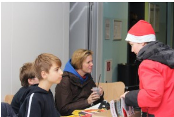
Tintenklexstand am Adventsmarkt

Die FörderStaRS freuen sich, die "Tintenklexe" aber auch noch zusätzlich unterstützen zu können, indem wir für ihre Arbeit eine niegelnelneue Kamera mitsamt großer Speicherkarte finanziert haben. Wir wünschen euch weiterhin viel Spaß bei euren zukünftigen Projekten und freuen uns auf viele schöne Fotos von euch!